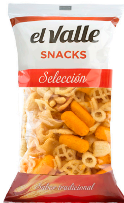
■ COCKTAIL SNACKS