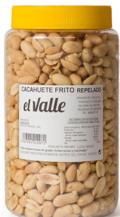
CACAHUETE FRITO REPELADO