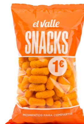
■ GUSANITO ROJO