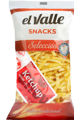
■ BARRITAS KETCHUP