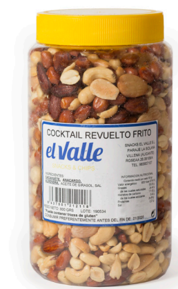
COCKTAIL FRUTOS SECOS FRITOS