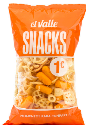
■ COCKTAIL SNACKS