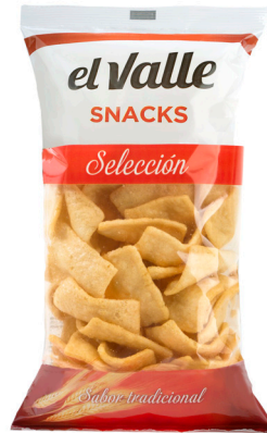
■ CORTEZA DE TRIGO