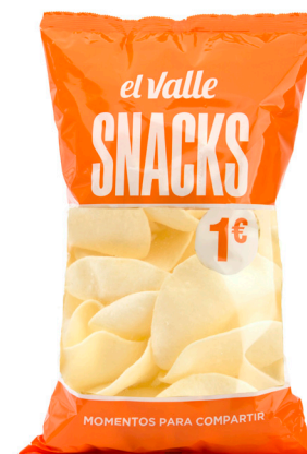
■ PATATA CHIC