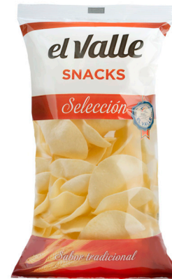
■ PATATA CHIC