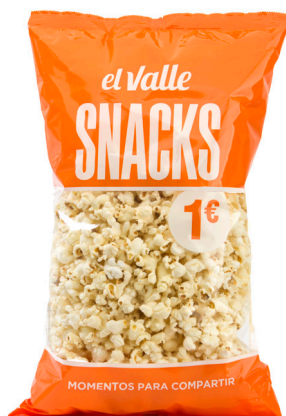
■ PALOMITAS SALADAS