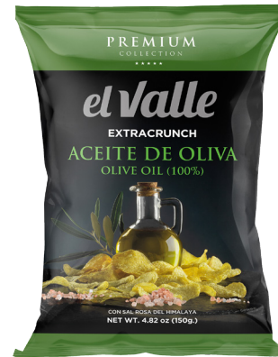
ACEITE DE OLIVA Y SAL DEL HIMALAYA