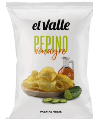
PEPINO Y VINAGRE