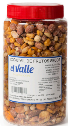
COCKTAIL FRUTOS SECOS