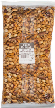
COCKTAIL FRUTOS SECOS BOLSA