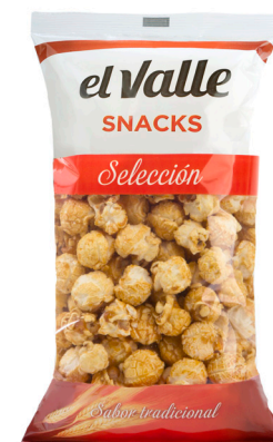
■ PALOMITAS DE CARAMELO