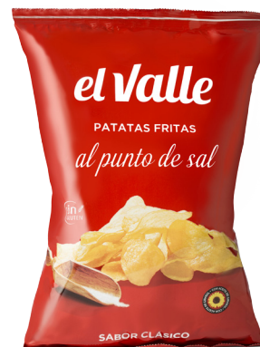
AL PUNTO DE SAL