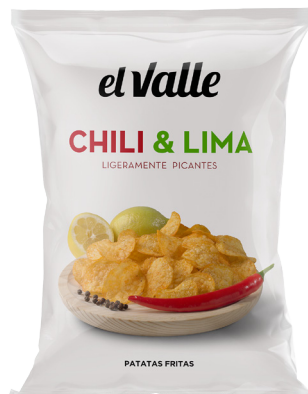
CHILI & LIMA