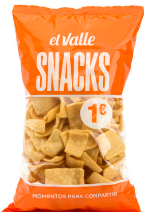
■ CORTEZA DE TRIGO