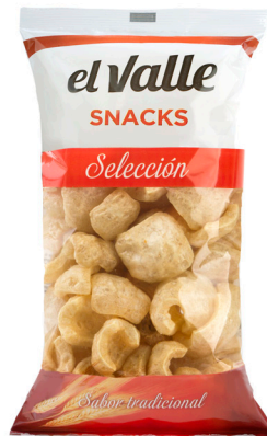
■ CORTEZA DE CERDO