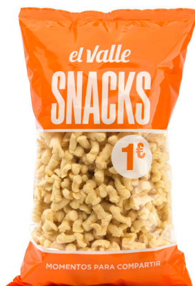
■ PALOMITAS DE MANTEQUILLA