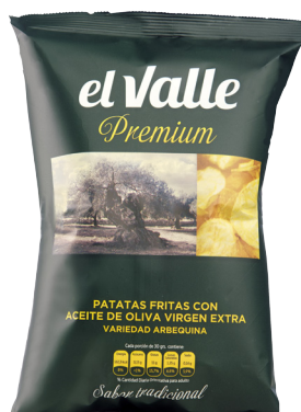
ACEITE DE OLIVA