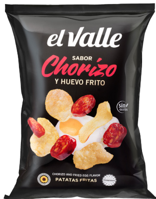
HUEVO FRITO CON CHORIZO