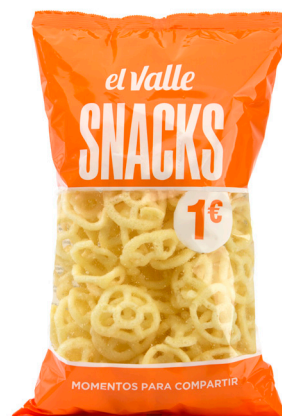
■ RUEDAS DE PATATA