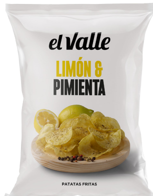
LIMÓN & PIMIENTA