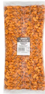
COCKTAIL RANCHO CHILI