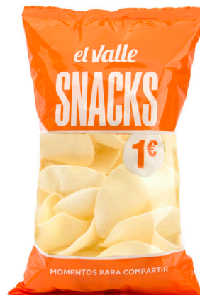
■ PAN DE GAMBA